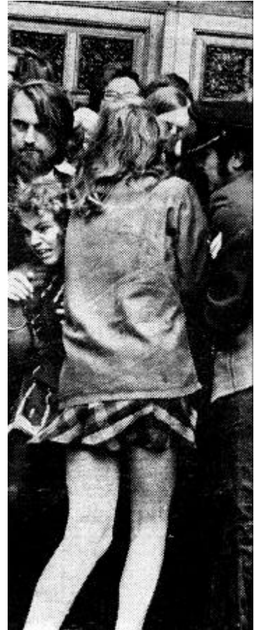
Manifestation étudiante 1972, Université d'Utrecht